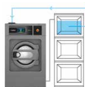
AHORRO DE AGUA DEPÓSITO 3 Agua del último lavado para el siguiente prelavado