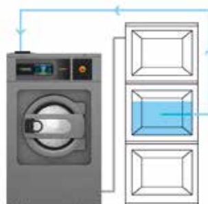
AHORRO DE AGUA DEPÓSITO 2 Agua del primero/segundo aclarado