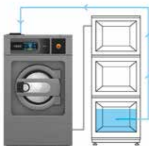
AHORRO DE AGUA DEPÓSITO 1 Agua del último aclarado