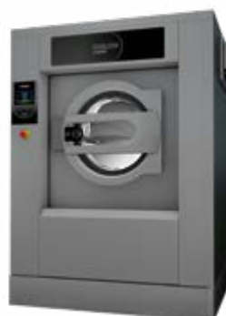
BARRERA SANITARIA DE 16 A 100 KG