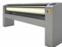
PLANCHADORAS Ø180 / Ø250 mm