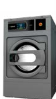
LAVADORAS FRONTALES DE 11 A 120 KG