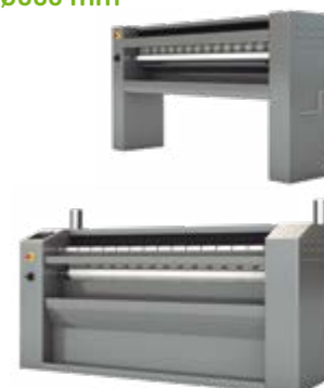
CALANDRAS MURALES Ø200 / Ø325 mm Ø500 / Ø650 mm