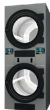
BOMBA DE CALOR DE 11 A 22 KG