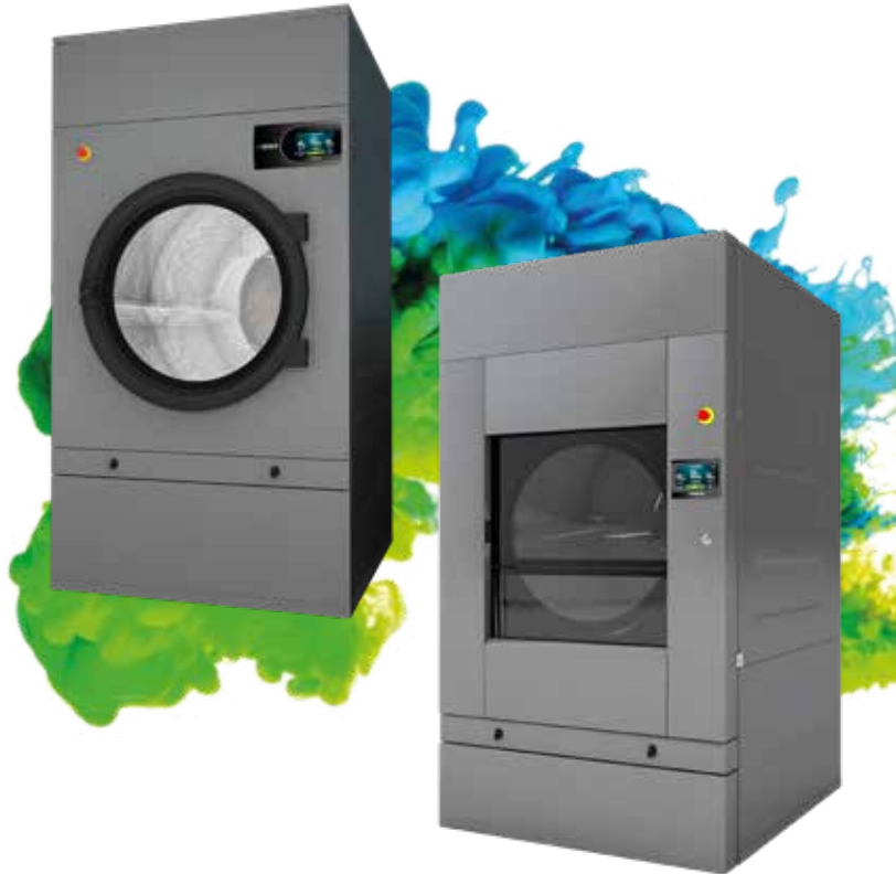
Porte coulissante automatique

Batterie vapeur inox (pression jusqu'à 15 bar) Carrosserie en skinplate gris, aspect inox SFEX - Système anti-incendie SOFT DRY - Nouvelles perforations du tambour COOL DOWN - anti-froissement en fin de cycle Chauffage électrique, gaz ou vapeur Homologation CE